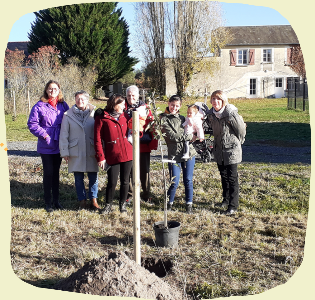
Une naissance, un arbre