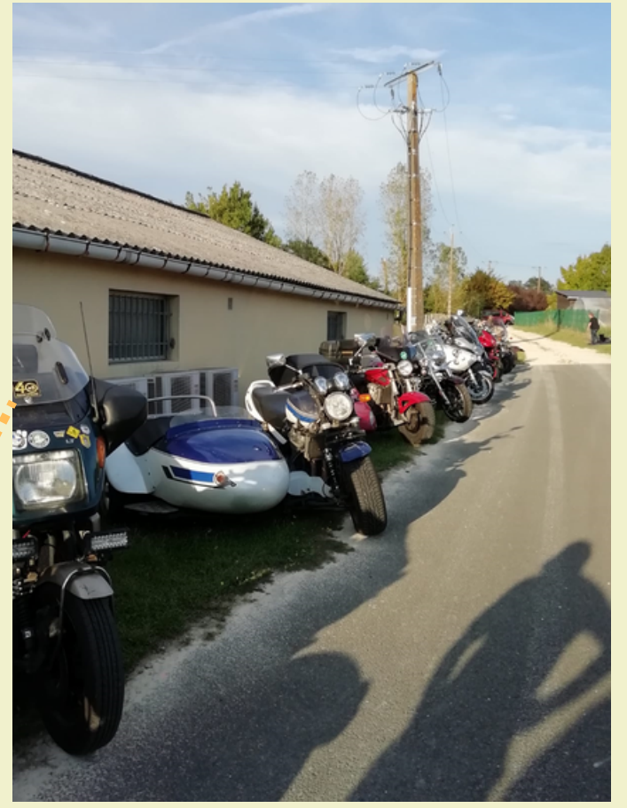
Motos à la Joyeuse