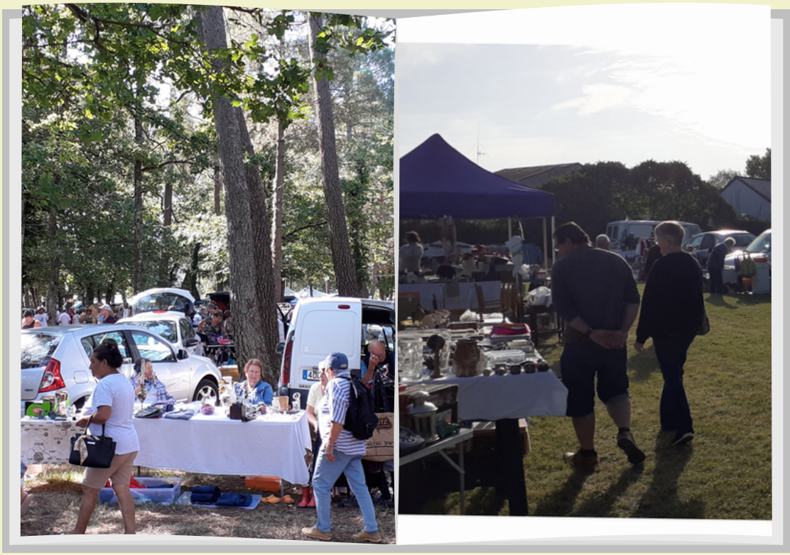
Brocantes du Bourg et des Loges