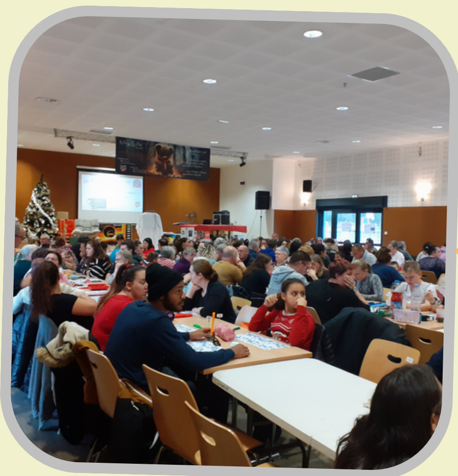
Loto de l'association Wany the Pooh